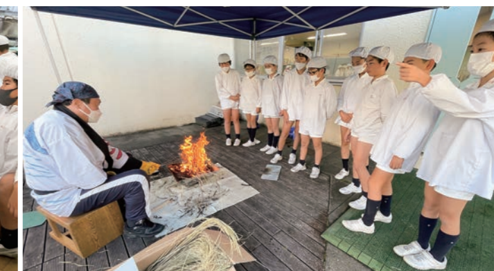
校長によるカツオのたたき