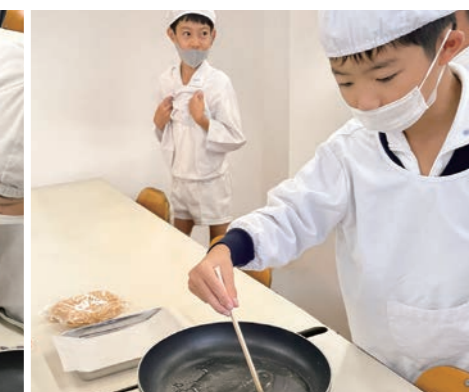
雷おこし用の水あめを混ぜている様子