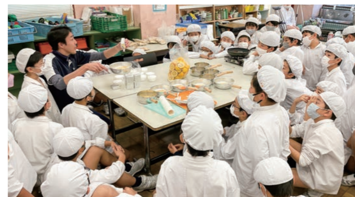
クリーミーレモン作り