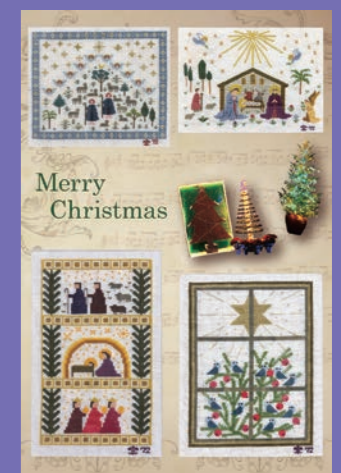
2025年度クリスマスカード