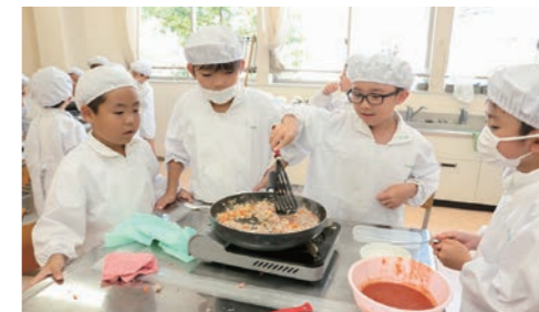
2年 ミートソースを調理する(生活科)

家庭科は、自身の生活に足場を置いて家庭や自分とつながる社会を見つめ、どのように生きるかを考える場となります。衣食住に関する実践的な活動を通して、人の日常生活に欠かすことのできない基礎的な知識・技能を習得していきます。今の生活から「よりよく生きる」ためにどのような道を選び実践するか考えて行動する力を身に付けることができるのが、家庭科の魅力だと考えています。一方、生活・総合科は「自然のものを知り大切にすること」「自分の周りの人が幸せになるようにすること」を学びます。隣接したこの二つの教科は生活に関わる体験、五感、すなわち「味覚」「聴覚」「嗅覚」「視覚」「触覚」の5つの感覚を総動員した学びを重視しています。