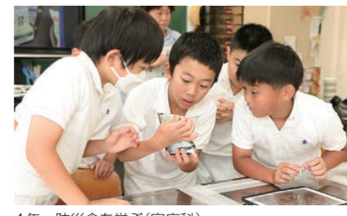
4年 防災食を学ぶ(家庭科)