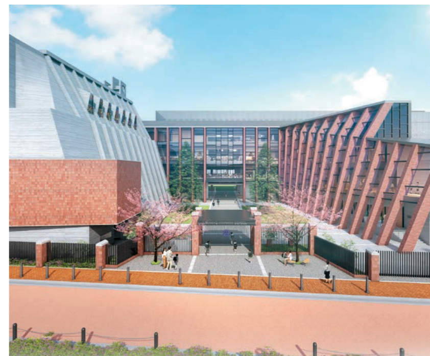
設計・監理: (株)石本建築事務所