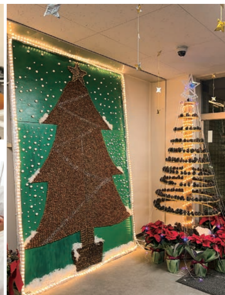
2年 どんぐりでクリスマスツリーを作る(生活科)