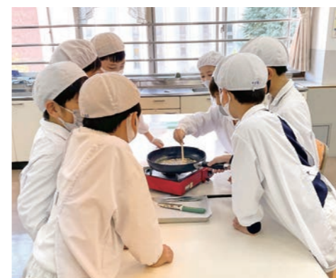
雷おこしを作成中