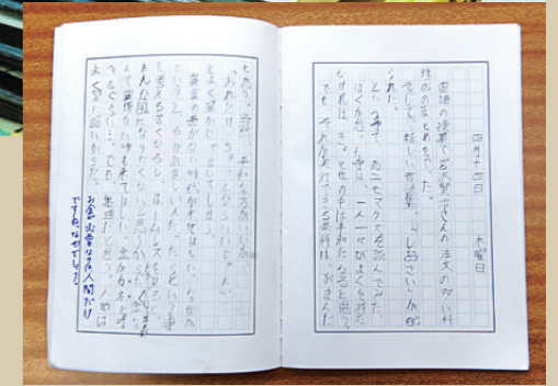
文章のみの日記(高学年)

立教小学校では1年生から絵日記が始まります。一日を振り返り、それを絵や文章でかくことによって、確実に表現力や言葉の力が高まるからです。自分の思いや考えを絵や文章にすることは、子どもから保護者・教員へのメッセージとなります。