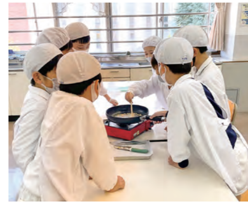
雷おこしを作成中