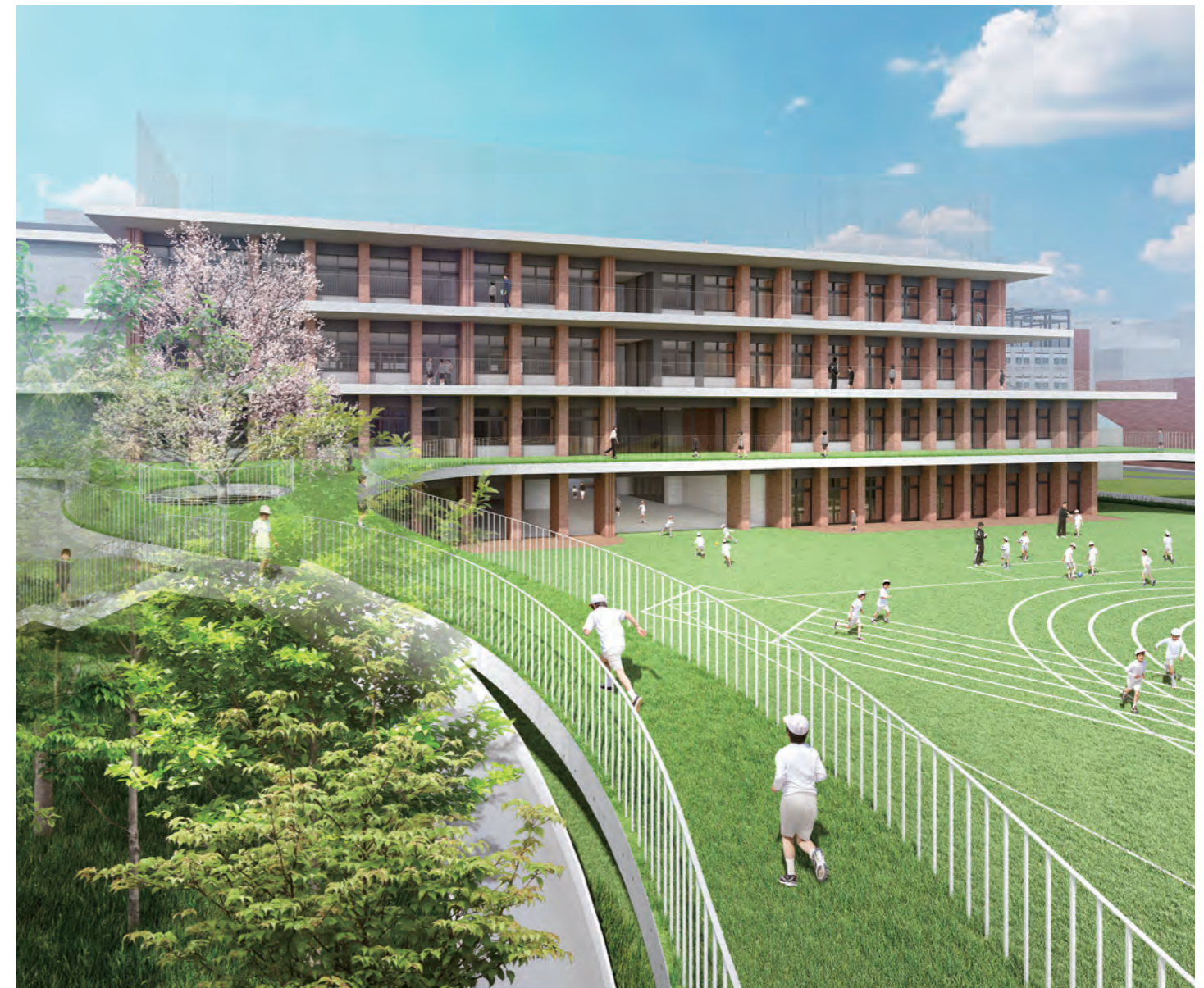
南側外観(イメージ)