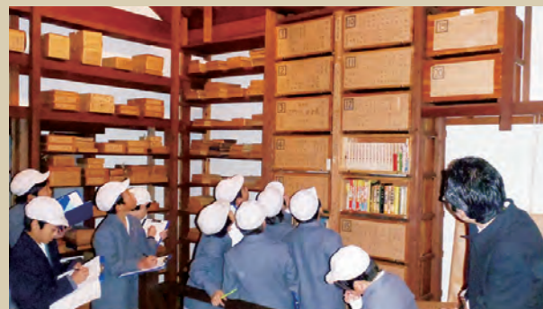
旧江戸川乱歩邸見学

読書科で厳選した400冊以上のおすすめの本をリストアップした冊子、「HON.YOMOよむよむよ」は、子どもたちが、多くの本とであう機会をつくり上げています。また、この冊子では、自らの読書記録をつけ、感想を書いていきます。本を読み、感想を書くことによって、考えをまとめる力が身につきます。