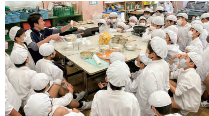
クリーミーレモン作り