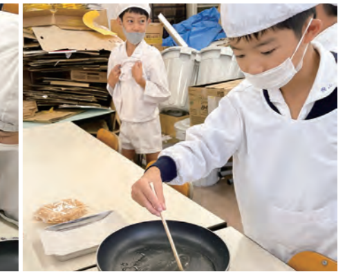
雷おこし用の水を混ぜている様子