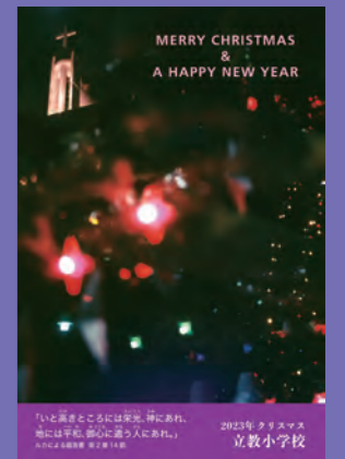
2023年度クリスマスカード