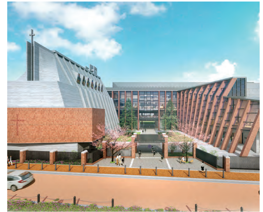
北側外観(イメージ)