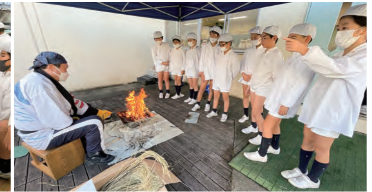
校長によるカツオのたたき