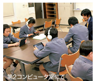
第2コンピュータ室にて

本校独自の教材を作成し「英語体験」を日常化することに努めています。6年生では、これまでのデジタル機器活用の集大成として、英語で自己紹介をするビデオ・レター作成による発信型の英語教育を実現しています。