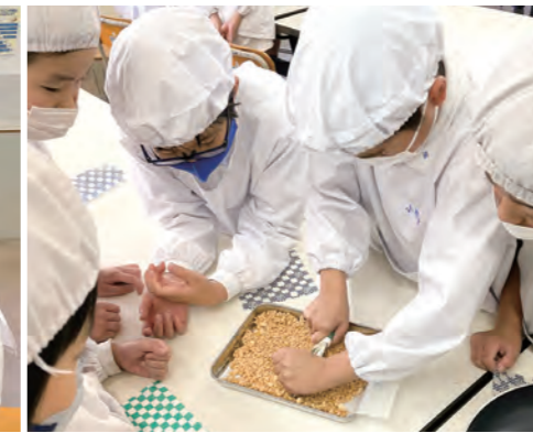
雷おこしを切断中